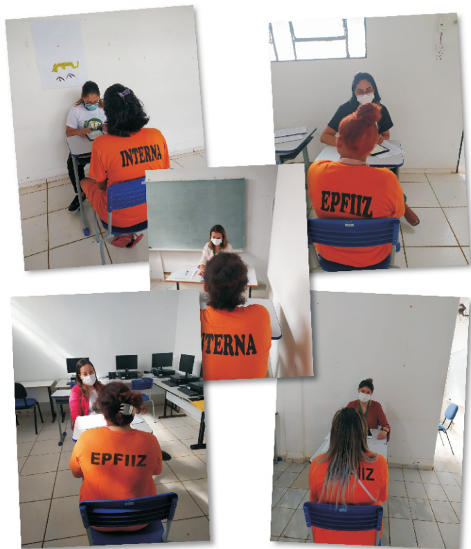
Equipe do NUDEM executando o projeto na Unidade Penal Irmã Irma Zorzi

A ação baseia-se na aplicação de questionário/pesquisa e atendimento jurídico individual cível às mulheres internas da Unidade Penal Feminina Irmã Irma Zorzi, a fim de elaborar diagnóstico a partir dos dados obtidos que considerem às especificidades das mulheres presas e fundamentar e promover o atendimento pelo NUDEM das demandas individuais e coletivas.